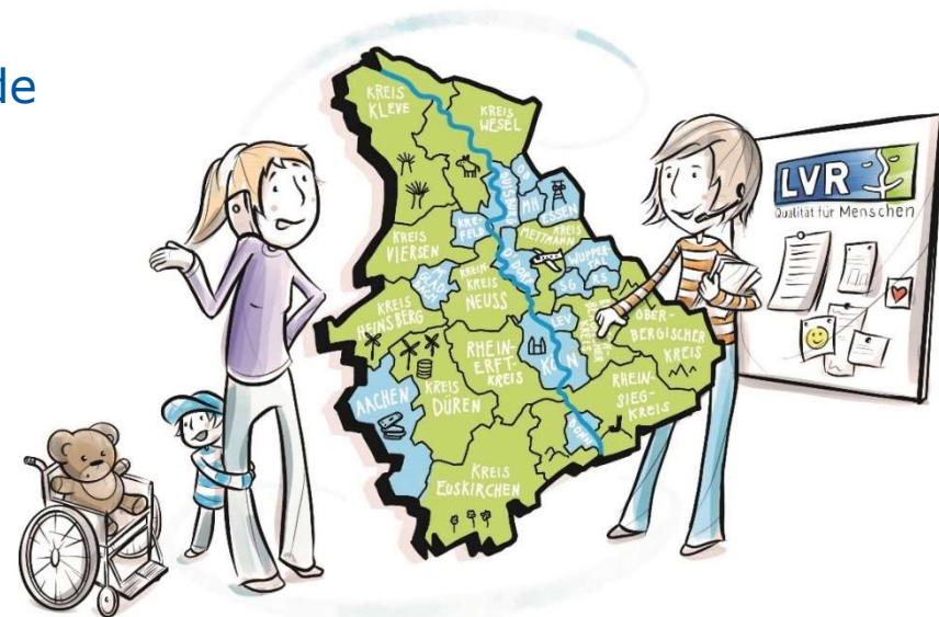
Illustration: Stefanie Levers