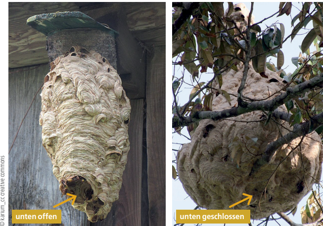
Europäische Hornisse ( Vespa crabro )