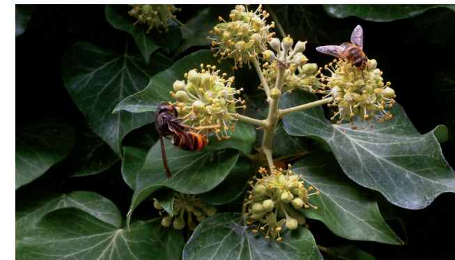
Asiatische Hornisse auf Efeu

Nachdem das Laub abgefallen ist, sind die großen Nester in den Kronen von Laubbäumen gut zu erkennen.